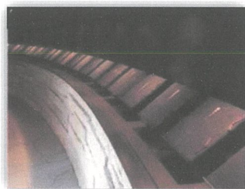
祈念碑の内部(名簿二十五巻所蔵)