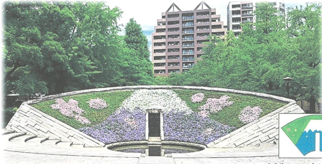
「東京空襲犠牲者を追悼し平和を祈念する碑」 令和6年度春花壇