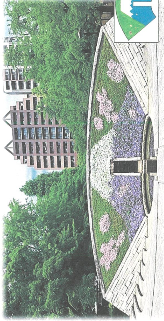
「東京空襲犠牲者を追悼し平和を祈念する碑」 令和6年度春花壇