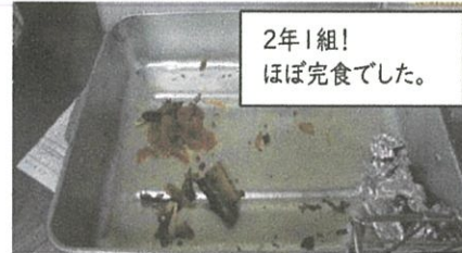
2年1組！ ほぼ完食でした。

9月の給食で「さんまの姿煮」を食べました。骨まで食べられるように柔らかく煮ましたが、骨の苦手な子にとってはハードルが高かったかもしれません。教室ではお箸を上手に使って丸ごと食べるこ子、半身だけきれいに食べる子といういろいろでした。