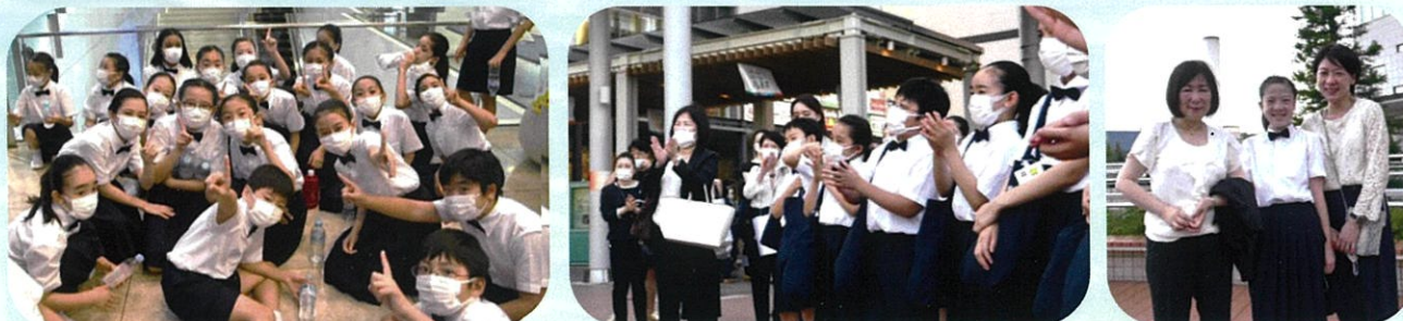
歌い終わったあとは、いつもの笑顔 会場外での終礼も笑顔があふれています 行ってらっしゃい！比賣宮さん