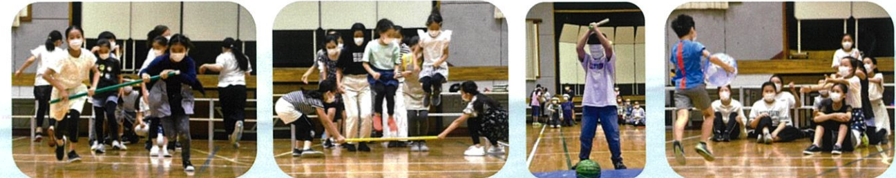
お楽しみ会、壮行会はいつも大盛り上がり！ 今年のすいか割りも...ヒット連発でした🍉