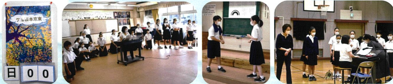
東京都大会本選の朝 みんなの緊張を解くためにあっち向いてホイ大会！勝ったのは...?! 体育館での声出して、細かく確認