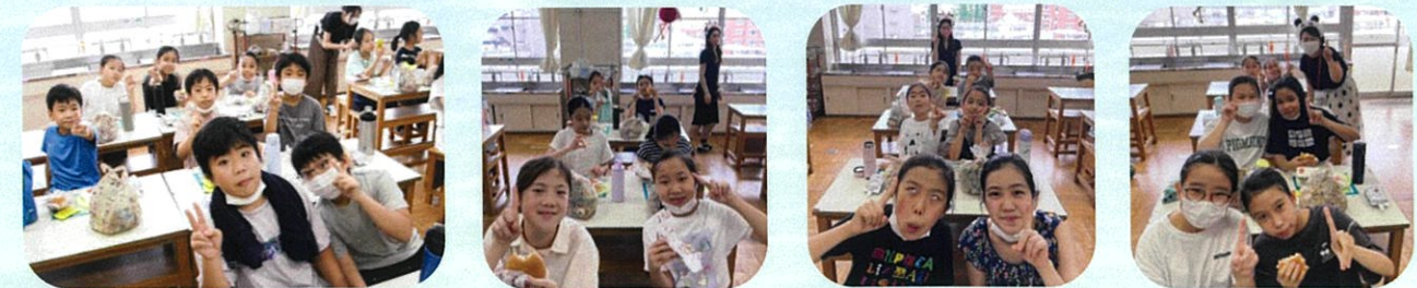
おやつタイムは唯一のマスク無しのみみんなの笑顔が見られます