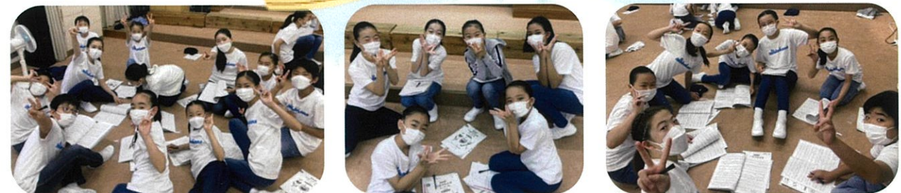
練習中に先生に指導された内容をパートごとに集まっておさらい中